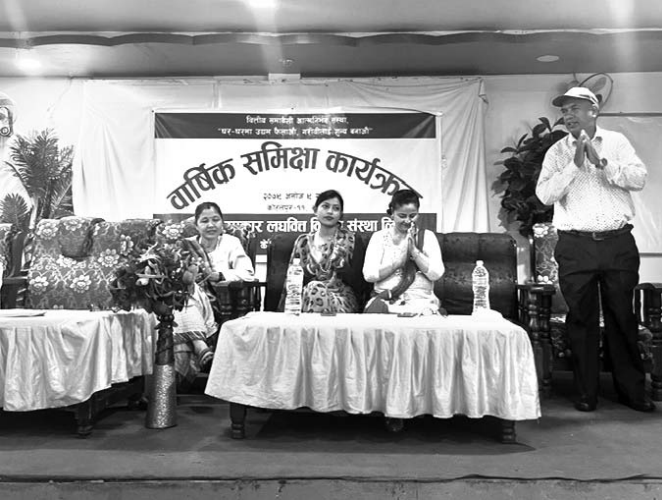
वार्षिक समीक्षा बैठक