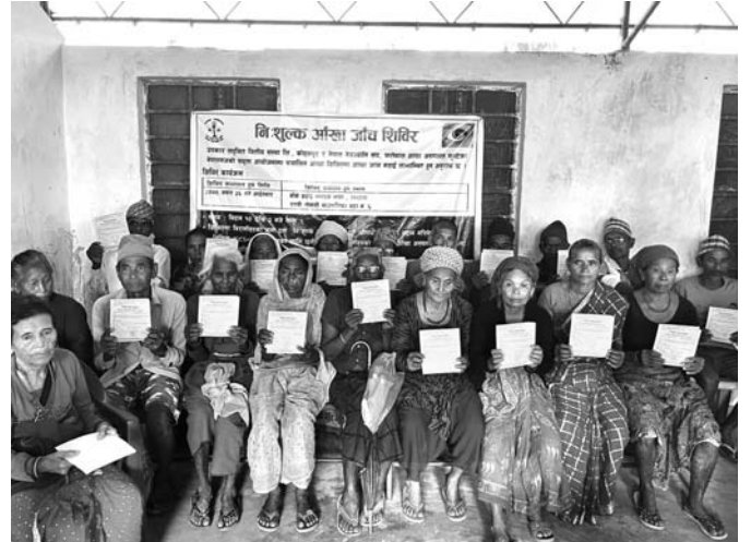
आँखा शिविर कार्यक्रम