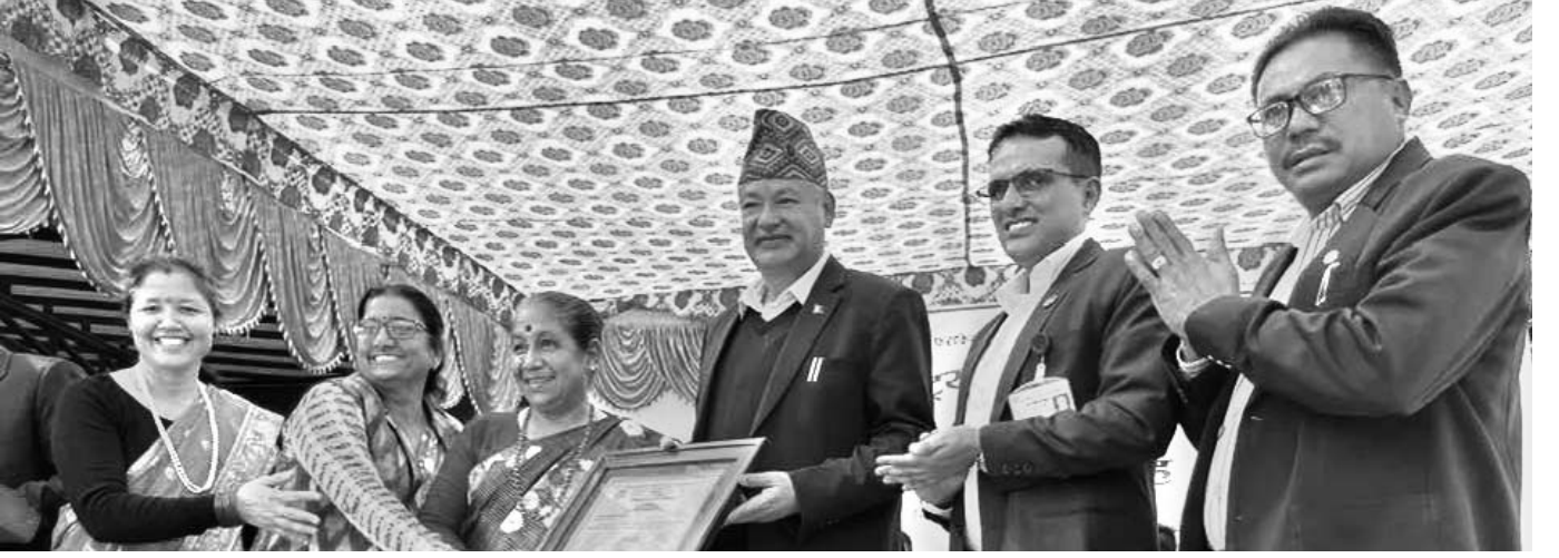
करदाता सम्मान कार्यक्रम, नेपालगंज