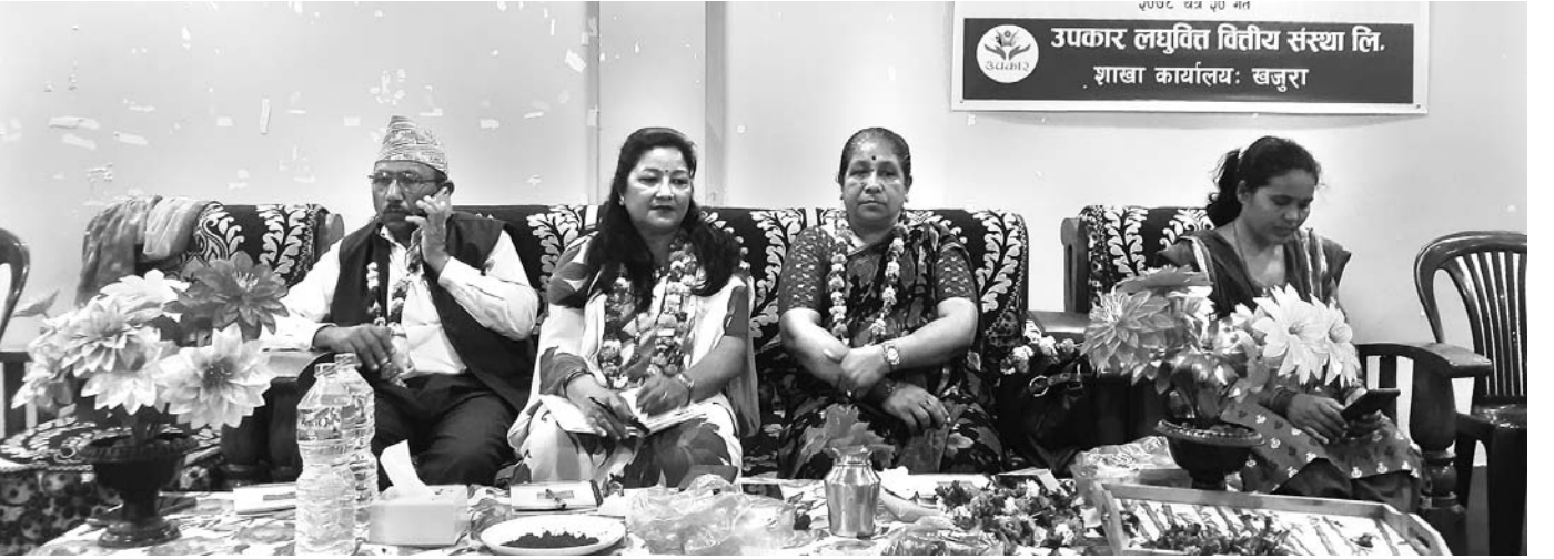
केन्द्र प्रमुख गोष्ठी