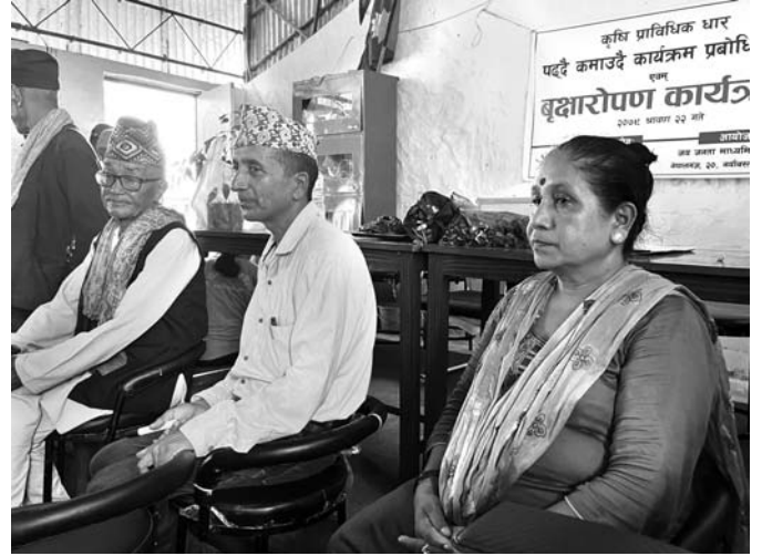
पह्दै कमाउदै कार्यक्रम, नेपालगंज