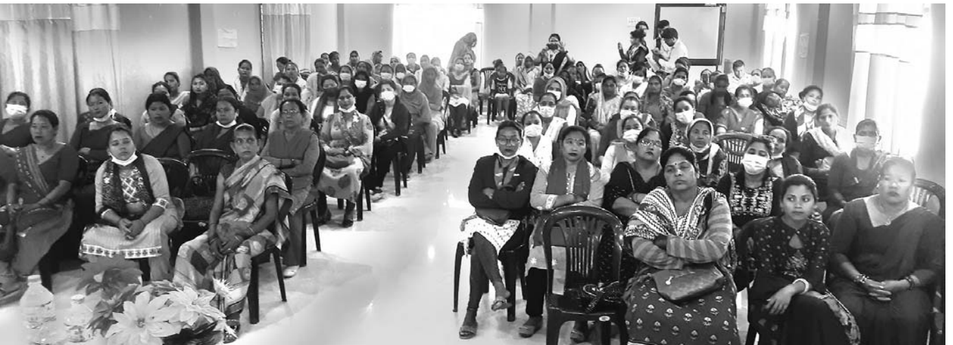
केन्द्र प्रमुख गोष्ठी