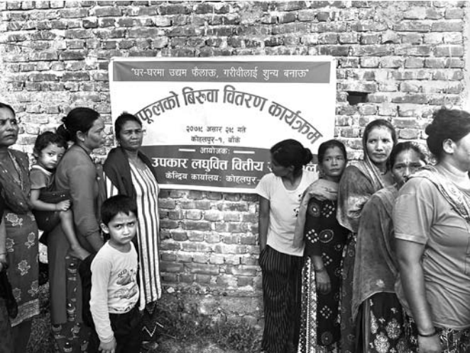
विरुवा वितरण कार्यक्रम