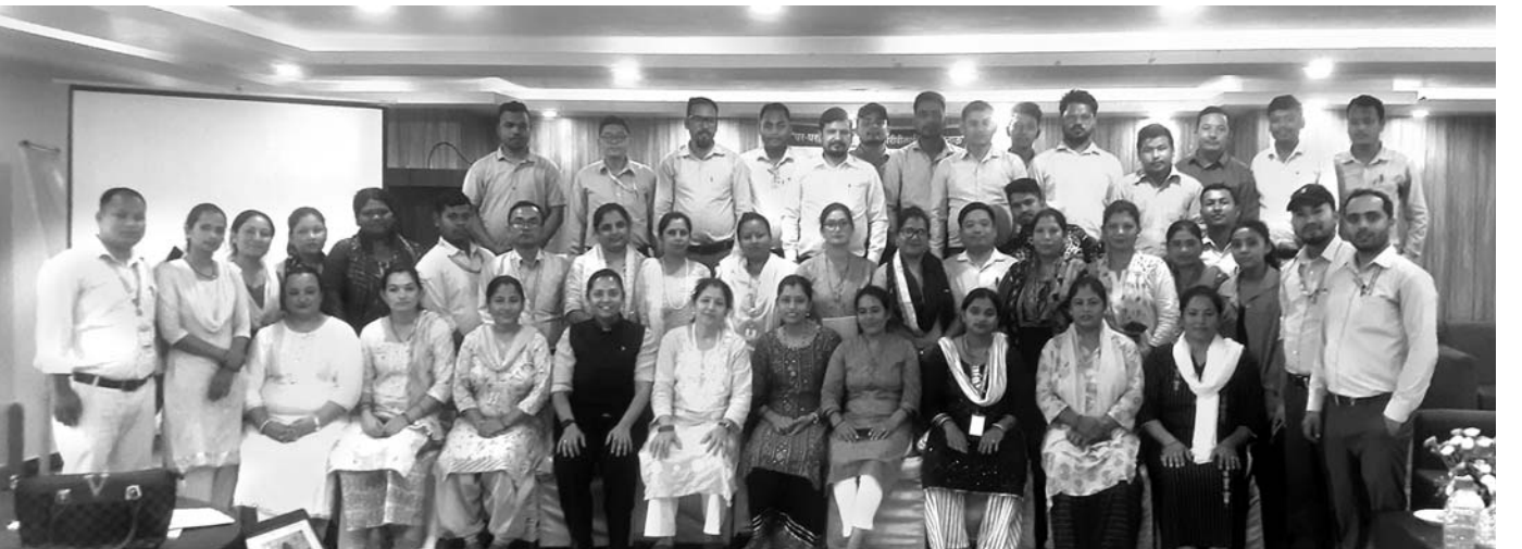
कर्मचारी तालिम, कोहलपुर