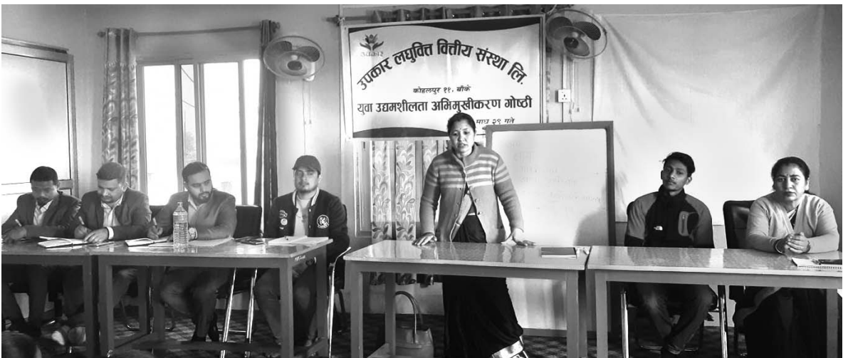
युवा उद्यमशीलता अभिमुखीकरण गोष्ठी कार्यक्रम