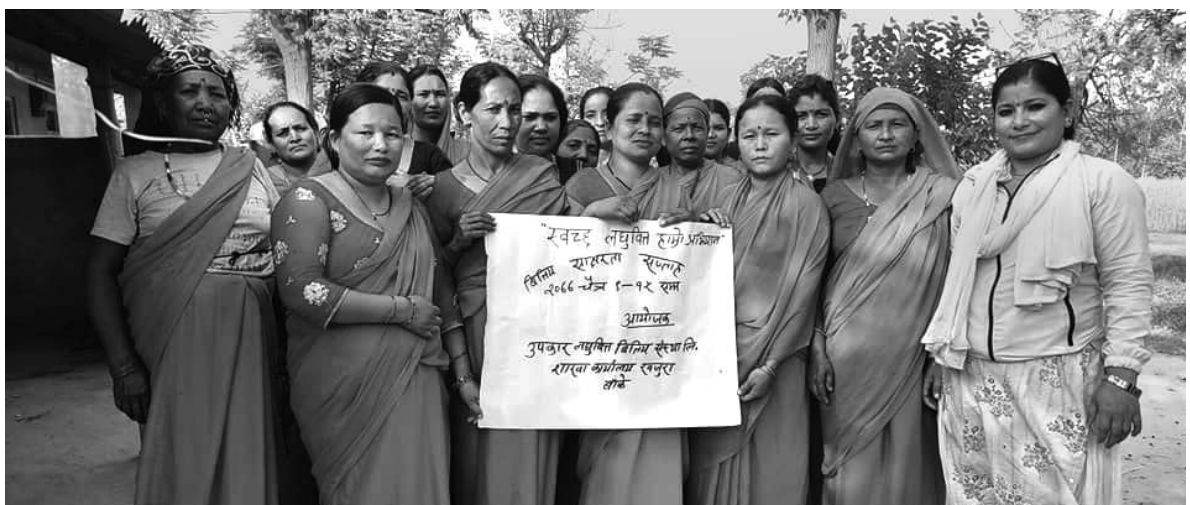
वित्तीय साक्षरता सप्ताह कार्यक्रम, खजुरा