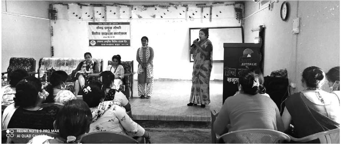
केन्द्र प्रमुख गोष्ठी कार्यक्रम, खजुरा