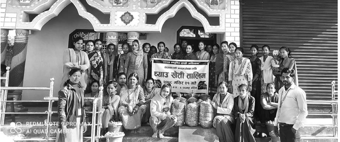
पदनाह, बर्दिया शाखा