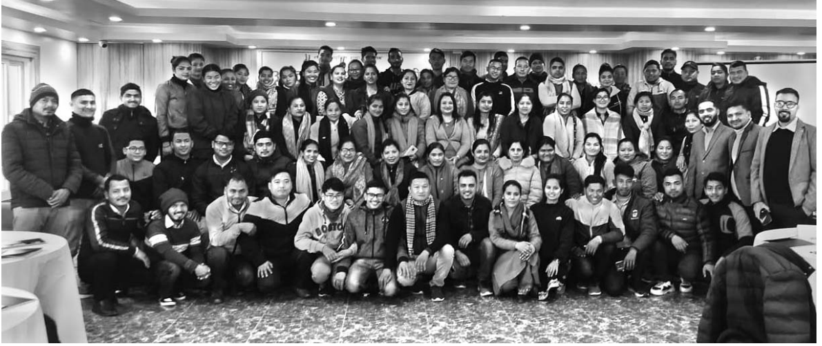
अर्धवार्षिक समीक्षा बैठक