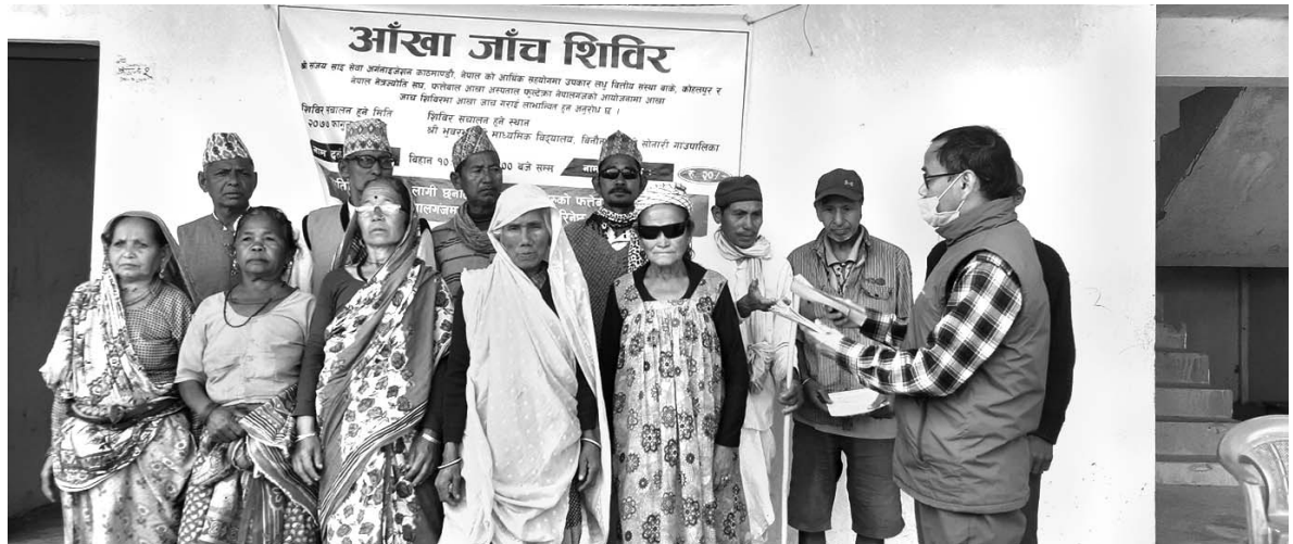
आँखा जाँच अभियान कार्यक्रम